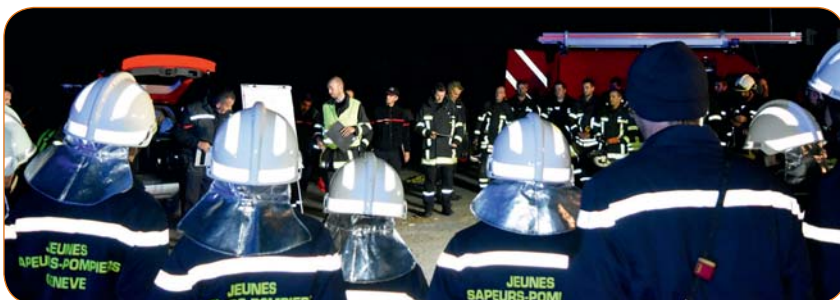
20 jeunes sapeurs-pompiers de la Ville de Genève ont suivi tout le déroulement de l'exercice.