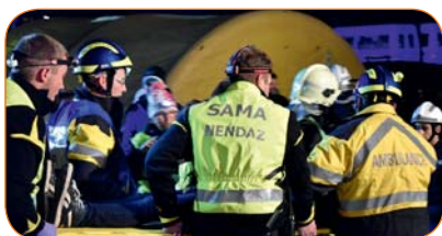
Un médecin, des ambulanciers et des samaritains étaient également présents.