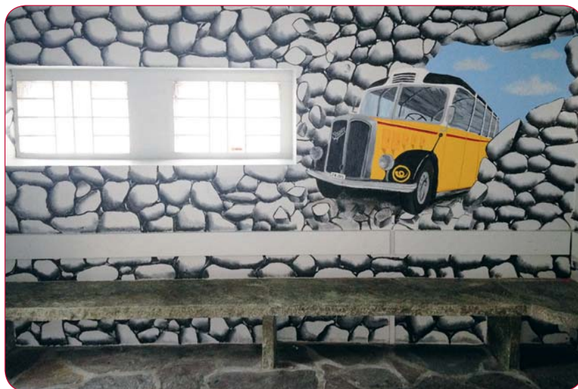
L'abribus de Basse-Nendaz avant, pendant et après les travaux !