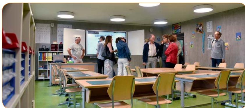
Une soirée portes ouvertes avait été organisée à la nouvelle école d'Aproz le 18 août dernier.

La nouvelle salle de gymnastique d'Aproz sera fonctionnelle d'ici la fin de cette année 2015 alors que l'école a elle déjà ouvert ses portes en août dernier (voir encadré). Pour fêter la fin de la construction de cet important complexe scolaire, la Direction des écoles a décidé de mettre sur pied une pièce avec l'ensemble des élèves de 1H à 8H de Nendaz et Veysonnaz. Les écoliers ont été répartis en 2 groupes : ce sont donc 250 enfants qui se retrouveront sur scène lors de chaque représentation.