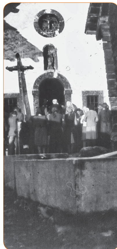
Photo de la chapelle Saint-Michel prise par le chanoine lui-même.