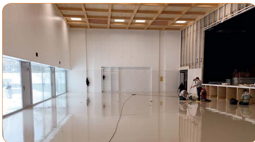
La nouvelle salle de gym au moment des dernières finitions.