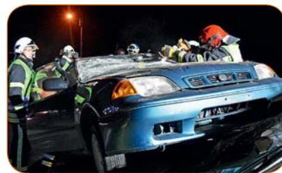
Le véhicule est décapoté pour permettre aux secours d'en sortir la victime.