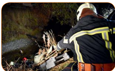
Un corps est remonté du lit de la Printse.