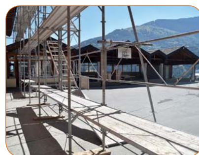
Cet été, les travaux se sont poursuivis au cycle d'orientation de Basse-Nendaz.

Restera pour 2019, une rénovation de l'intérieur de cette dernière, sol, chauffage et engins compris. ■