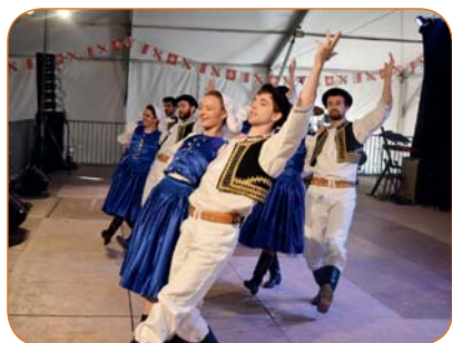
Des danses folkloriques de Slovaquie, de Bohème et de Moravie (Tchéquie) avec le groupe Folklor 75.