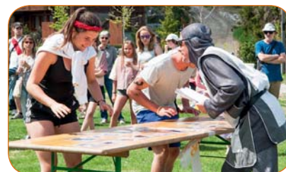
Un peu de réflexion avec ce jeu autour de la mode au Moyen-Âge. © Charly Venetz