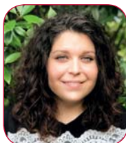
Joly Oriana © DR