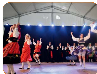
Groupe folklorique portugais de Fully.