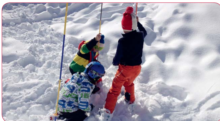
Initiation des jeunes à l'utilisation d'un détecteur de victimes d'avalanche.

Le module « Esprit Piste » comprend un volet théorique et un volet pratique. Dans un premier temps, en classe, les enseignants présentent et commentent aux enfants le flyer illustrant les 10 règles édictées par la Fédération internationale de ski (FIS). La deuxième phase se passe sur les pistes de ski en compagnie des patrouil-