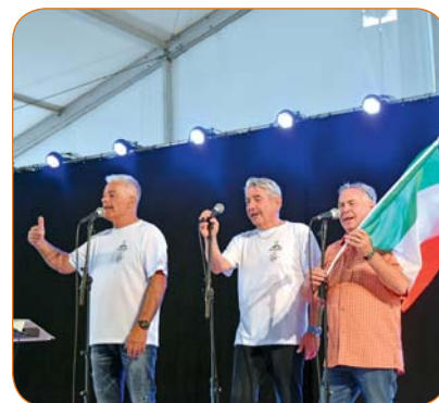
Le Trio Salentino.