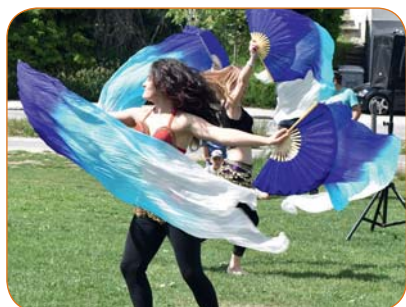
Un joli moment d'évasion avec les danseuses orientales.