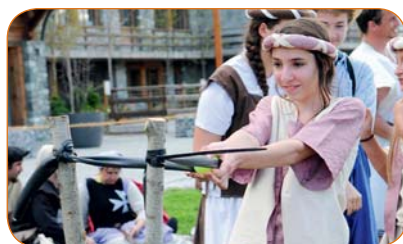
La catapulte ou l'art de savoir doser son élan pour toucher la cible.