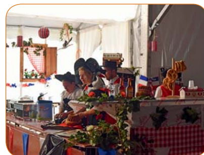
Le stand français.