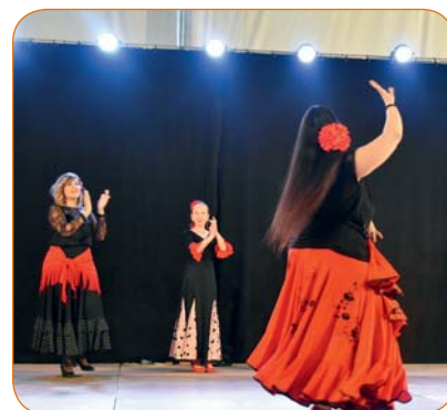
Du flamenco envoûtant avec Alma Flamenca.

Plus de photos sur www.nendaz.org/feteinterculturelle2018