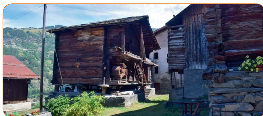
Ce coin sera très animé le 15 septembre prochain !

faisait souvent autrefois, et partager un moment de convivialité !