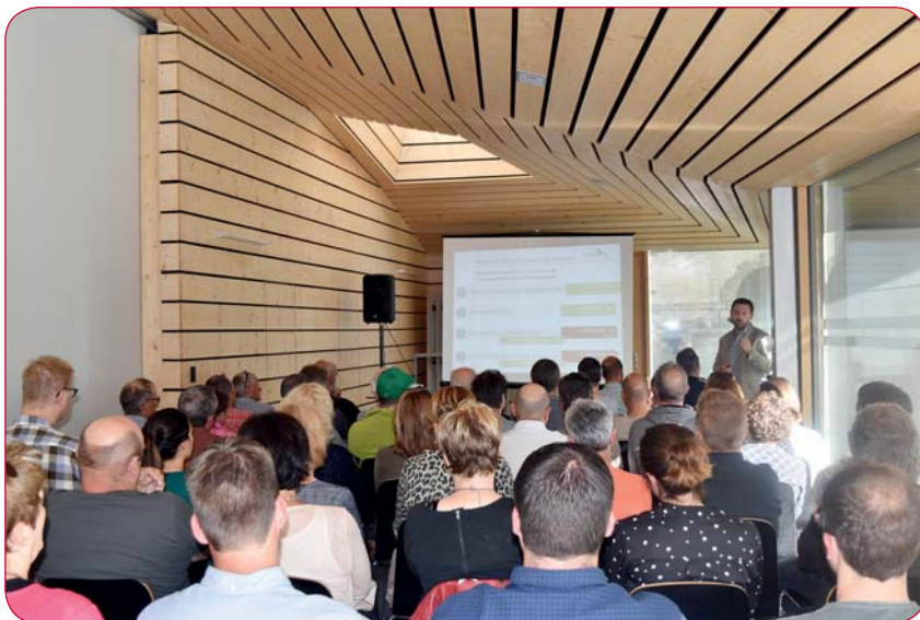
Un public nombreux a participé à la rencontre des entreprises locales.

La première rencontre des entreprises locales initiée par la commission communale Economie et Tourisme a eu lieu le jeudi 14 juin dernier. Plus de 60 commerçants et artisans ont répondu présents afin de s'informer et de discuter du tourisme, secteur essentiel de notre économie.