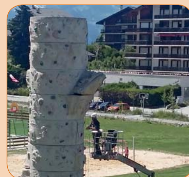
De nouvelles prises ont été ajoutées aux tours d'escalade.

Une cinquantaine de prises ont été ajoutées aux deux tours d'escalade qui se trouvent sur la plaine des Ecluses à Haute-Nendaz. Leurs ascensions s'en trouvent donc facilitées. Elles sont ainsi accessibles aux petits et grands qui souhaitent goûter au plaisir de l'escalade. Pour rappel, il est cependant nécessaire pour s'y essayer d'avoir un équipement ad hoc et les connaissances nécessaires pour s'assurer. Nendaz Sport y propose régulièrement des cours et Nendaz Tourisme y organise une initiation durant l'été.