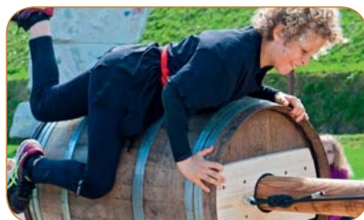
Peut-on trouver l'équilibre à califourchon sur ce tonneau.