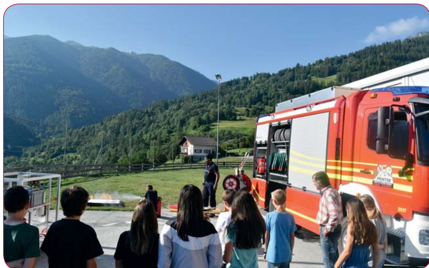
Place à la pratique!

Le Commandant du feu est aussi responsable de prévoir un plan d'évacuation des écoles (comme des EMS et des crèches). Plusieurs exercices ont déjà eu lieu et les professeurs sont formés sur le comportement à adopter en cas d'incendie.