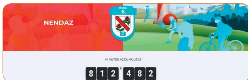
Nendaz est la 6 e commune ayant accumulé le plus grand nombre minutes de mouvement durant la semaine de la Suisse bouge.