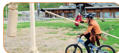
La quintaine à vélo, une réinterprétation contemporaine de ce jeu d'adresse qui consiste pour le chevalier à toucher un bouclier avec sa lance.