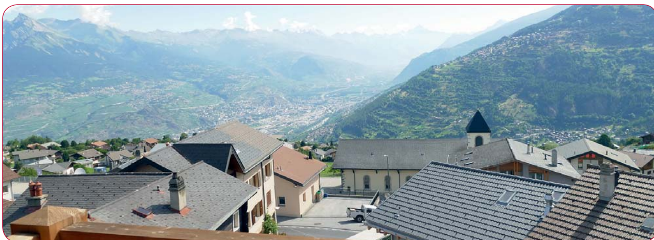
Certains appartements offrent une très belle vue.