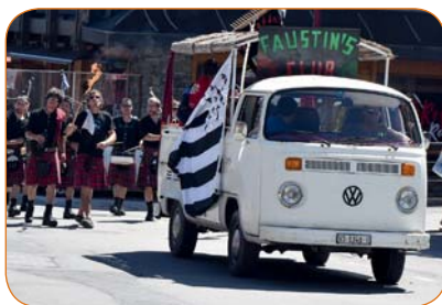
Les Faustin's d'Isérables étaient de la partie, autant pour mettre l'ambiance sous la tente que lors du cortège qui a marqué le début de la manifestation.