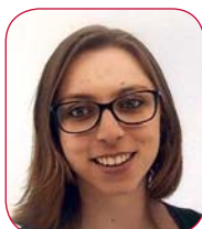
Fournier Morgane © DR