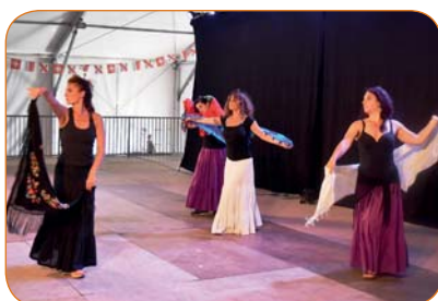
Les danseuses du Giant Studio ont donné du relief à de jolies mélodies italiennes.