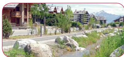
Réaménagement de la plaine des Ecluses.

Le renforcement du financement du tourisme nendard, avec une forfaitisa-