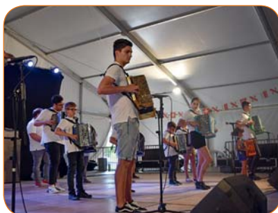
Groupe d'accordéonistes portugais.