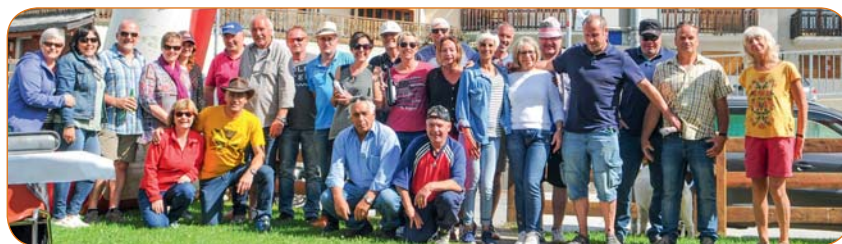
Les participants au tournoi de pétanque des jubilaires.