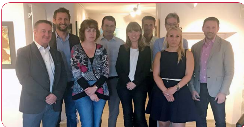
C'est au Nind'Art qu'a eu lieu cette matinée de réseautage.

Les douze administrations communales les plus importantes en termes de personnel sont représentées au sein de ce réseau professionnel, soit Bagnes, Colloby, Conthey, Fully, Martigny, Montana, Monthey, Nendaz, Savièse, Sierre, Sion et Saint-Maurice. Tout au long de l'année, leurs responsables RH sont en contact, essentiellement par email, pour comparer leurs pratiques et partager des idées. Cet échange continu de compétences ne peut que profiter à chacune des administrations.