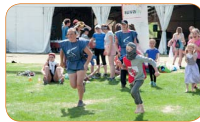
Cette journée conviviale a rassemblé petits et grands.

Le traditionnel tournoi des jubilaires a rassemblé, le samedi 12 mai, environ 25 personnes nées en 1948, 1958 ou 1968. Sur la place Gherla à Haute-Nendaz, elles ont passé une belle journée placée sous le signe de la pétanque mais aussi de la convivialité.