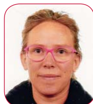
Hoche pied Ingrid

Les Conseils communaux, les Commissions scolaires de Nendaz et Veysonnaz ainsi que la Direction des écoles leur témoignent leur confiance et les remercient par avance pour leur implication dans l'instruction et l'éducation de la jeunesse de nos deux communes. ■