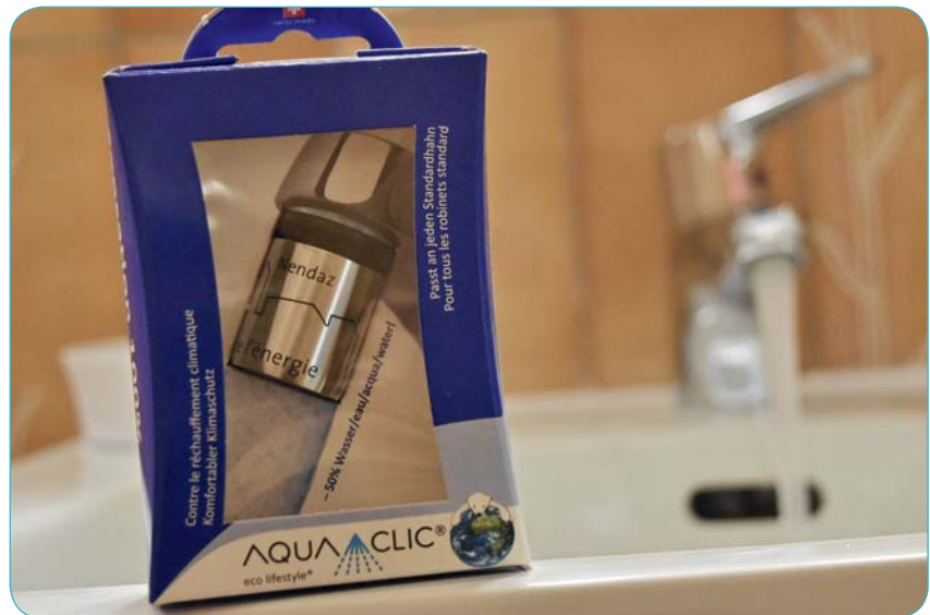
Ce réducteur de débit s'installe sur la grande majorité des robinets.

votre engagement en faveur de l'environnement !