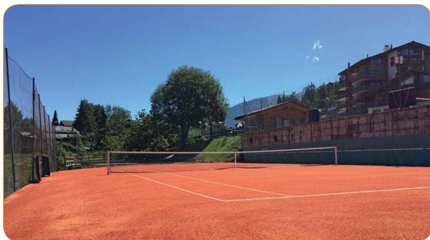
Les courts du Chaèdo sont désormais comme neufs !

A noter que la route donnant accès à la piscine a également été rénovée. ■