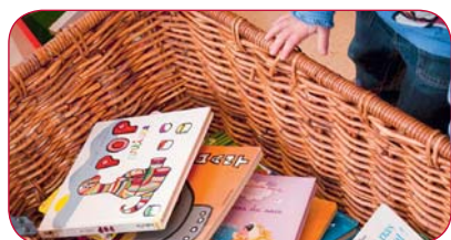
Les ateliers des petits lecteurs reprennent à la rentrée !

Ces animations gratuites et sans inscription sont ouvertes à l'ensemble des enfants de la commune, particulièrement aux enfants migrants et leurs parents. L'idée est simple : se familiariser avec la langue française tout en créant des liens avec la population locale avant l'entrée à l'école.