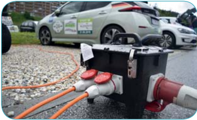
Les bornes de la Plaine des Ecluses ont été utilisées comme jamais.

Les participants ont chargé leurs batteries sur la plaine des Ecluses avant de passer par l'école de Haute-Nendaz pour saluer les élèves.