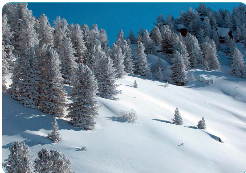
■ L'homme n'a pas laissé sa trace dans ce paysage immaculé.