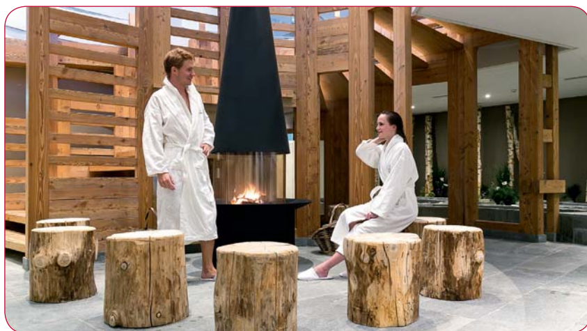
Avec le spa de l'hôtel Nendaz 4 Vallées, la station a étoffé son offre touristique.

Oui, et dans les mêmes proportions qu'en hiver. Mais malgré tout, pour la plupart des prestataires, l'été n'est pas vraiment rentable. Il faut dire que les touristes ont bien moins d'occasions de dépenser à la belle saison : un billet piéton coûte moins cher qu'un forfait de ski et l'équipement pour partir en randonnée est moins onéreux ! Pour que la période estivale et automnale profite à nos partenaires, une augmentation du volume touristique se révèle nécessaire, ce qui passe par l'élaboration de produits rentables et la création de nouvelles attractions.