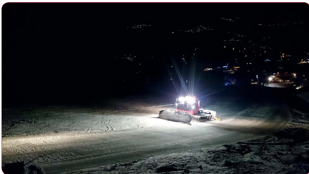
Un conducteur de dameuse travaille essentiellement la nuit.

L'association des remontées mécaniques suisses proposent cependant un cours sur une semaine. Cette formation allie théorie, notamment avec un volet sécurité, et travail sur le terrain. Elle s'achève par un examen à la fois écrit et pratique.