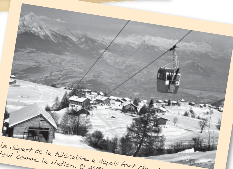
Le départ de la télécabine a depuis fort changé, tout comme la station.