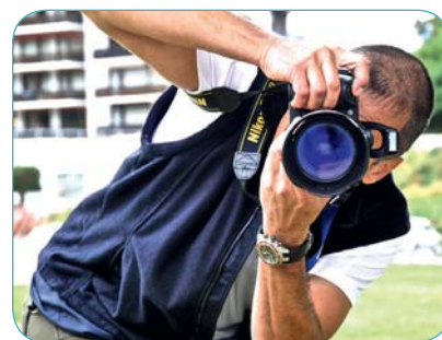
■ Envoyez-nous vos plus beaux clichés de Nendaz.

Nendaz, vous pouvez nous les envoyer à nadine.fournier@nendaz.org . Mentionnez simplement dans votre e-mail votre nom, le lieu dans lequel a été prise votre photographie, la date et, éventuellement, une petite légende explicative. Nous nous ferons un plaisir de la publier sur notre futur site internet.