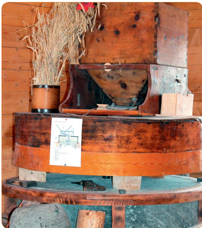
Partie éclatée du mécanisme du moulin pour la fabrication de la farine.

Les programmes de nos diverses manifestations ne sont pas encore définitifs. Vous trouverez prochainement de plus amples informations sur notre site Internet www.patrimoine-nendaz.ch , sur notre page Facebook «Sauvegarde du patrimoine nendard» et sur l'Echo de la Printse.