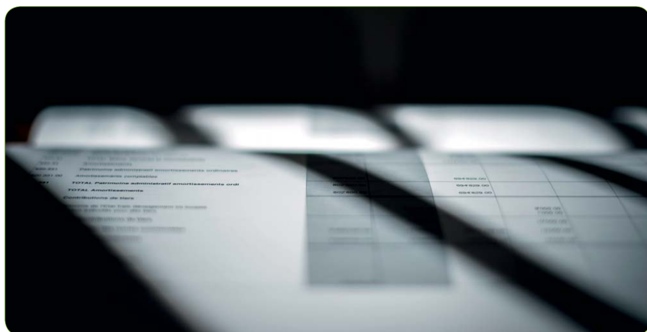
Les budgets de la Municipalité et de la Bourgeoisie ont été acceptés à l'unanimité.