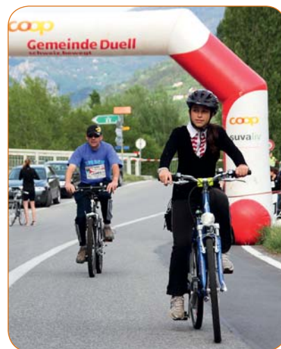
Prêt à pédaler pour faire gagner votre village?