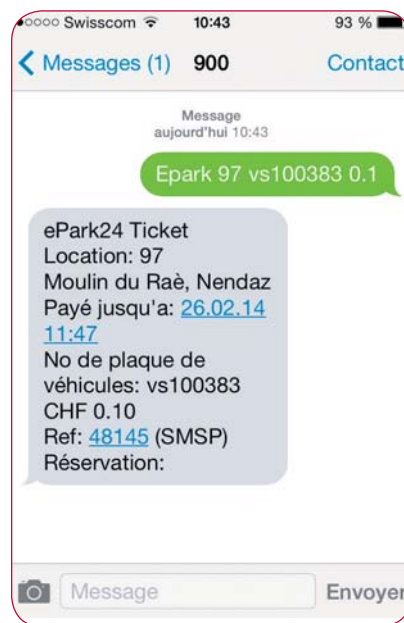
SMS de confirmation de paiement.