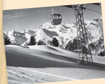
La première télécabine de Tracouet mise en service en 1958.