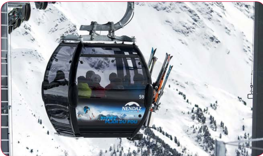
Depuis cet hiver, une nouvelle télécabine relie Siviez au Plan-du-Fou.