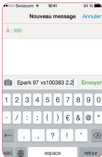
■ SMS envoyé pour payer son dû.

La durée maximale de stationnement est de sept jours. Attention, une place payée n'est pas une place réservée. Un ticket acheté au Moulin du Raè, à la Patinoire ou au complexe Mer de Glace est cependant valable dans l'ensemble de ces trois sites. Si un client quitte un parking qui, à son retour affiche complet, il peut donc se rabattre sur un autre parking communal, à l'exception de celui de Prameiraz/Télécabine.