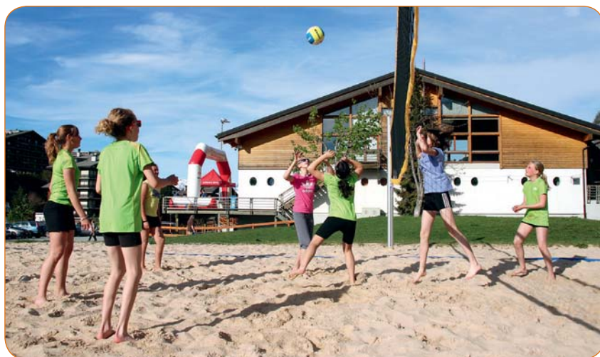
Une partie de beach-volley entre copines, c'est aussi du sport!

Comme lors de chaque édition, un programme sera mis sur pied et vous sera adressé par le biais d'un tous-