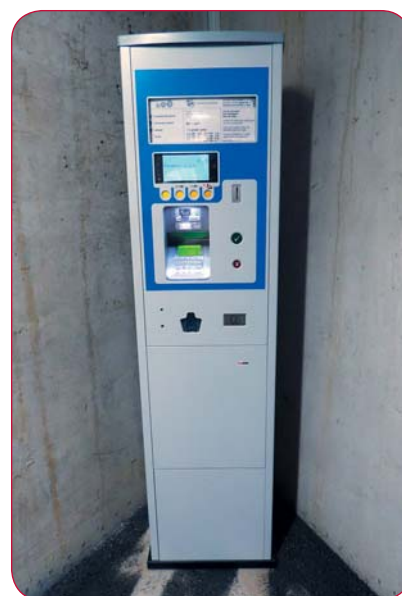
Plus besoin de monnaie grâce à cet horodateur des plus modernes.

Il suffit d'envoyer un SMS au numéro 900 avec le texte suivant (voir images ci-contre) : « Epark numéro du parking numéro de plaque et montant choisi ». Veillez à respecter les espaces. Dans les secondes qui suivent, un message de confirmation vous parviendra. Les frais seront dès lors ajoutés à votre facture de natel. Un seul autre SMS vous suffira pour prolonger à distance votre temps de parcage.