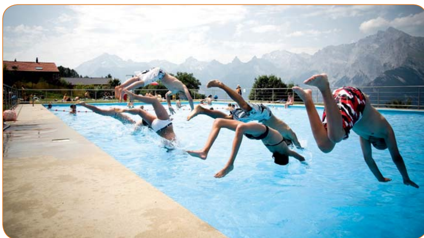
Vous pourrez plonger dans la piscine de Haute-Nendaz dès le 14 juin prochain.