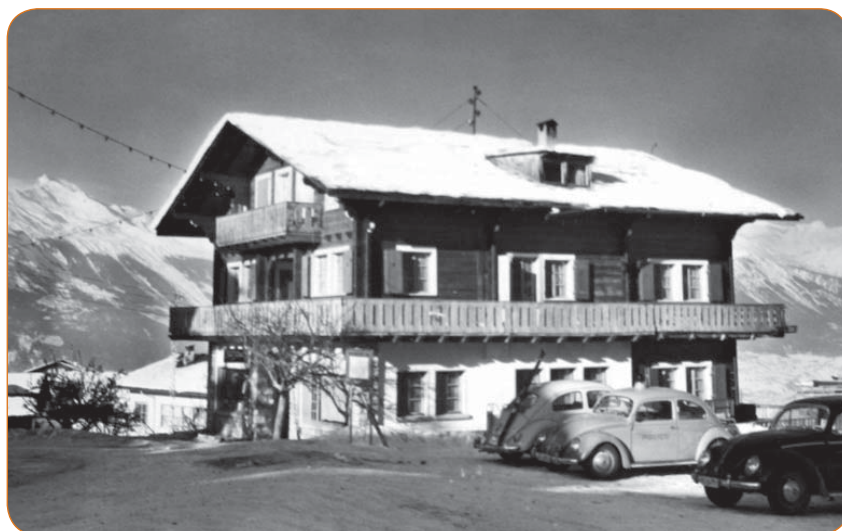
Le bâtiment Les Gentianes a déjà connu plusieurs affectations.